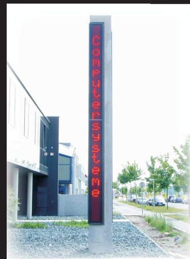
5,3m hohe, 2-seitige Ledsäule