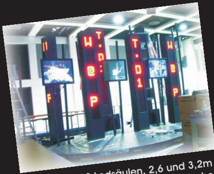
gesamt 12 Ledsäulen, 2,6 und 3,2m hoch, produziert für die Deutsche Telekom / Funkausstellung Berlin

ACT - Ledsäulen eignen sich bestens, um Textinformationen jeglicher Art auffällig, bewegt und aktuell anzuzeigen. Auch grafik- & videotaugliche Säulen in vielen verschiedenen Varianten lieferbar. Für den Innen- oder Außenbereich, Schriftgrößen von 30mm bis über 1.000mm, Led-Säulen in jeder Gesamthöhe möglich. Absolut wetterfeste Gehäuse. Einfachste Programmierung über die im Lieferumfang enthaltene Software.