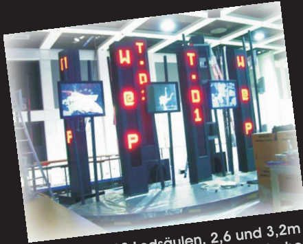
gesamt 12 Ledsäulen, 2,6 und 3,2m hoch, produziert für die Deutsche Telekom / Funkausstellung Berlin

ACT - Ledsäulen eignen sich bestens, um Textinformationen jeglicher Art auffällig, bewegt und aktuell anzuzeigen. Auch grafik- & videotaugliche Säulen in vielen verschiedenen Varianten lieferbar. Für den Innen- oder Außenbereich, Schriftgrößen von 30mm bis über 1.000mm, Led-Säulen in jeder Gesamthöhe möglich. Absolut wetterfeste Gehäuse. Einfachste Programmierung über die im Lieferumfang enthaltene Software.