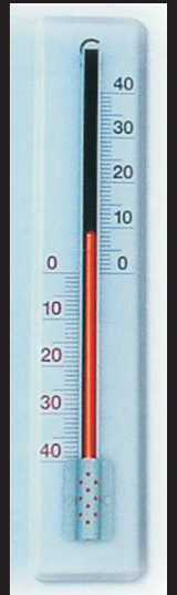
7m hohe Ledsäule - verwendet als animiertes Thermometer - Bergstation St.Moritz / Schweiz