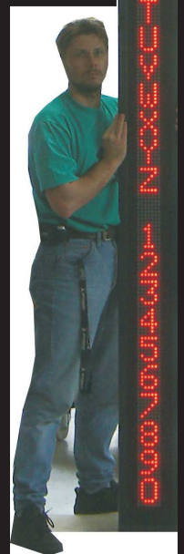
3,6m, 80mm Zeichen

Wir haben auch für Ihre Anwendung die richtige Lösung. Profitieren Sie von unserer großen Auswahl. Qualität ist unser Erfolg!