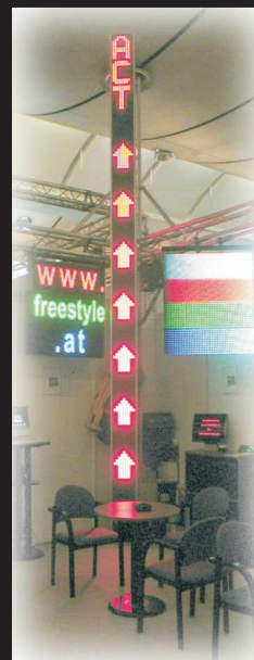
5,8m hoch, Messe CEBIT